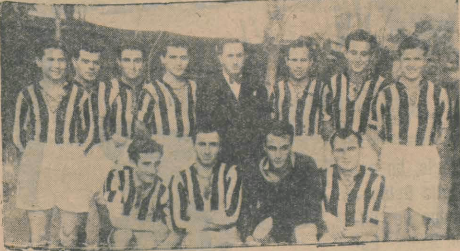
Profesyonelliği kabul edileceği söylenen Fenerbahçe takımı

Birkaç sporcuyu ve bir iki kulübü bütün Türk sporuna örnek tutamayız