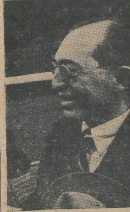
Milletler huzurunda dürüst davamızı bir kere daha ortaya koyan Hariciye Vekili Tevfik Rüştü Aras

Harici münasebetlere ve müşterek masrafların ifrazına ait bütün meselelere mütedair kararlar ittihadı ara ile ittihaz olunur. Confederation devletlerinden birinde tatbiki o devlet mevzuatı kanuni - (Devamı 6 ncı sayfada)