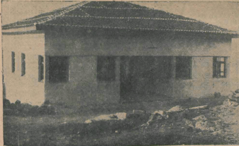
Dikilide 3 bin liraya mal olan asri mezbahe binası

Dikili, (Hususi muhabirimizden) — Dikili Ege kıyılarında hava ve suyla, güzel manzarasile, mütelevvi ve bereketli mahsulile sevimli bir kasabadır. Ekserisi obalardan ibaret olmak üzere 17 köyü ve 11 bin nüfusu olan bu yeni kaza merkezi «Dikili» kasabasının 3500 nüfusu olup bunun münevver ve ekseriyetini Rumeli mübadilleri teşkil eder. Zeki ve çalışkan olan halk gerek ziraat ve gerekse ticaret hususunda en yüksek kabiliyeti gösteren bir zümreden müteşekkildir. Bu sahalarda mesailerinin semerattan elde etmenin yolunu bilen münevver kimselerdir.