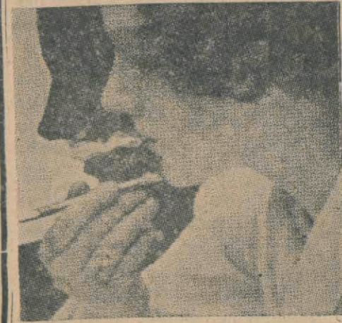
Kadınların sigara ile dişlerinin ve parmaklarının güzelliği kaybolmuyor mu, acaba?

Bazı kadınlara yumuşak tütünler hiç gelmiyormuş